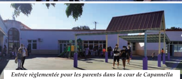
Entrée règlementée pour les parents dans la cour de Capannella