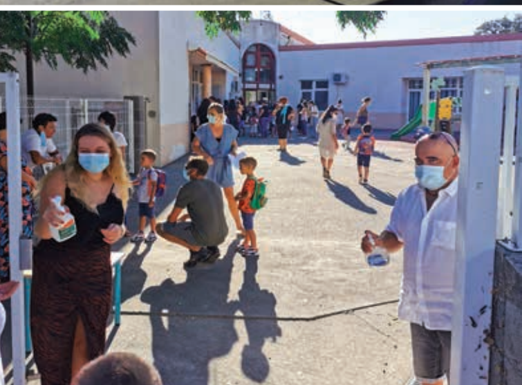
Port du masque et distribution de gel à l'entrée de Capannella