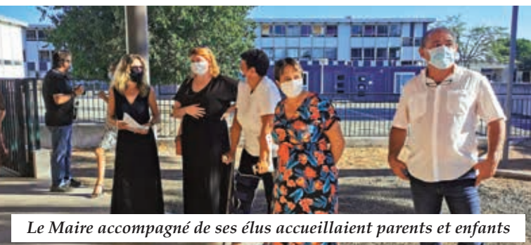
Le Maire accompagné de ses élus accueillait parents et enfants

Dans ce contexte sanitaire particulier, tout a été mis en place pour accueillir enfants et enseignants dans les meilleures conditions possibles.