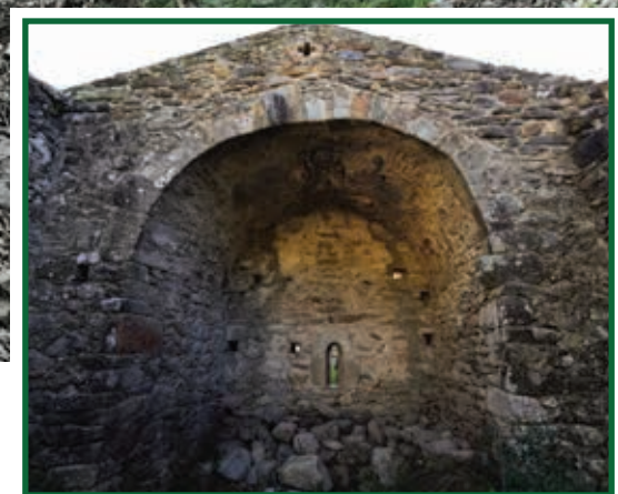
Ancien autel de l'église San Ghjuvani Evangelista

Un peu plus loin, sur un piton rocheux se dresse une bâtisse en ruine dont l'assise est celle de la Torra di Petrapola ou appelée Castellu di San Ghjuvani, hameau médiéval composé de plusieurs maisons et d'une tour. La légende mentionne le bandit Micaelli, dernier bandit du Fium'Orbu, qui aurait habité la tour. Sur les flancs, on peut encore voir la citerne médiévale et l'escalier permettant d'accéder à la tour, ainsi qu'un four à pain datant sans doute du XIXème siècle. Tout autour dans le