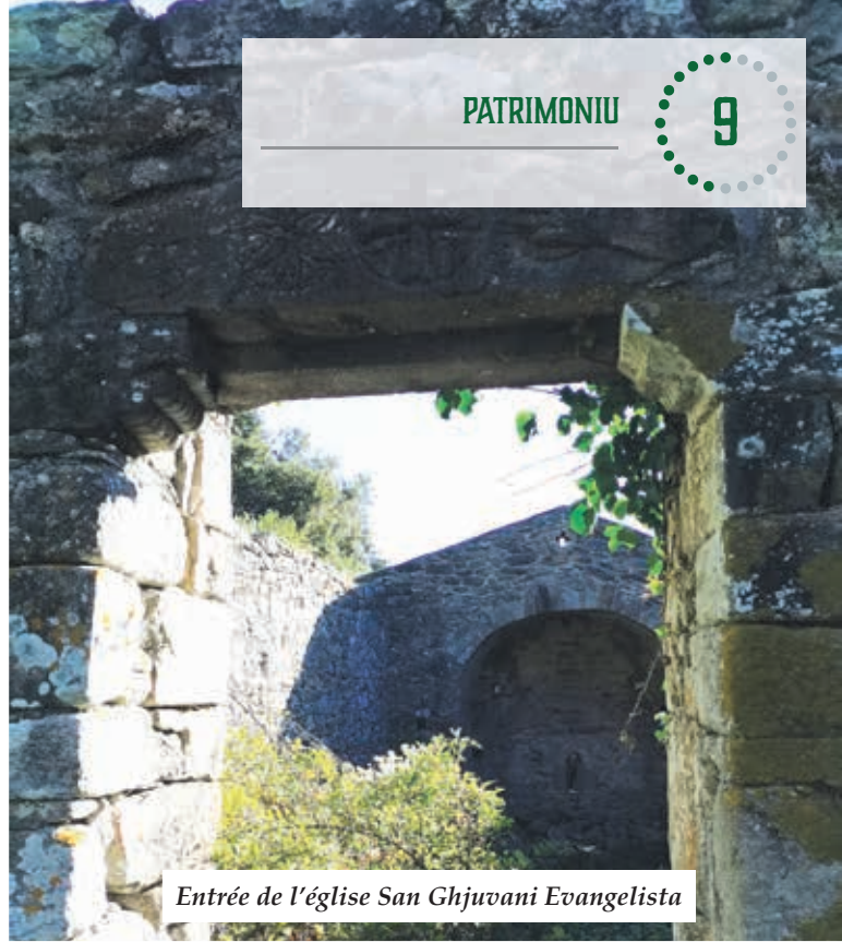
Entrée de l'église San Ghjuvani Evangelista

Son rôle d'élu lui permet également de suivre l'avancement de ces dossiers à la Communauté de Communes en insistant sur la réhabilitation de ces anciens chemins muletiers bordés de murs en pierre.