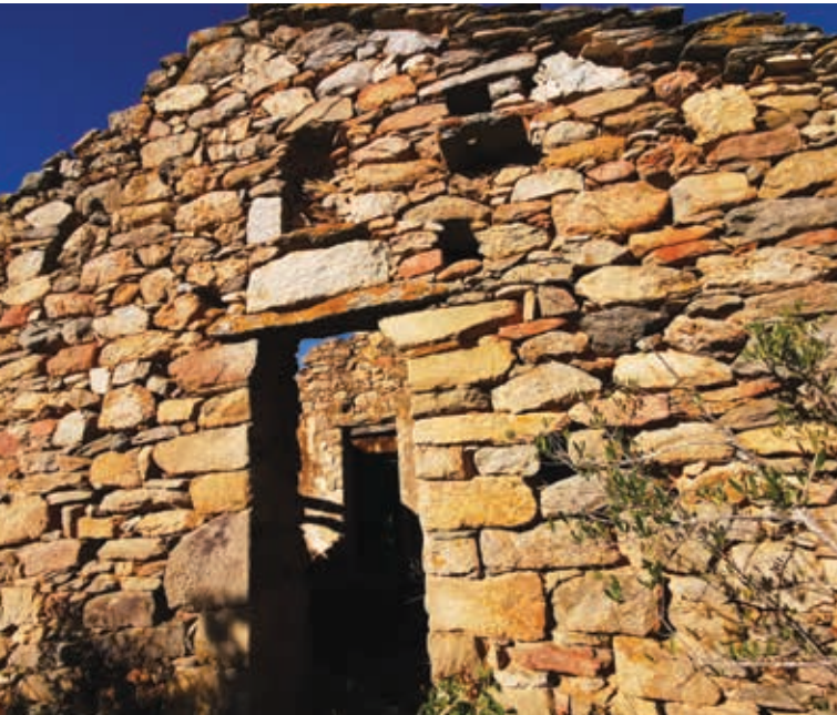
Torra di Petrapola ou Castellu di San Ghjuvani.

L'église pievane, cœur de la pieve de Cursa, a été fouillée par G. Moracchini-Mazel en 1974. Elle se trouve juste en bordure du chemin. De nombreuses pierres de cet édifice ont été réemployées dans les bâtiments ruraux voisins. Plusieurs pressoirs à raisins témoignent de l'importance de la culture de la vigne sur ces côtes.