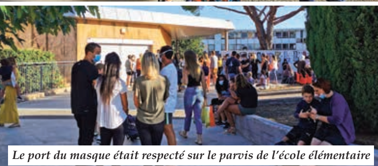
Le port du masque était respecté sur le parvis de l'école élémentaire