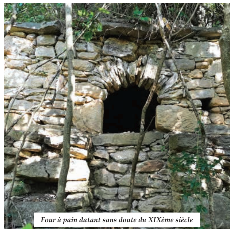
Four à pain datant sans doute du XIXème siècle

Ces futures boucles permettront d'aller à la découverte du riche passé de notre région, de la préhistoire à nos jours, avec plus particulièrement l'empreinte romaine médiévale, auprès d'un public varié, locaux, scolaires mais aussi touristes.