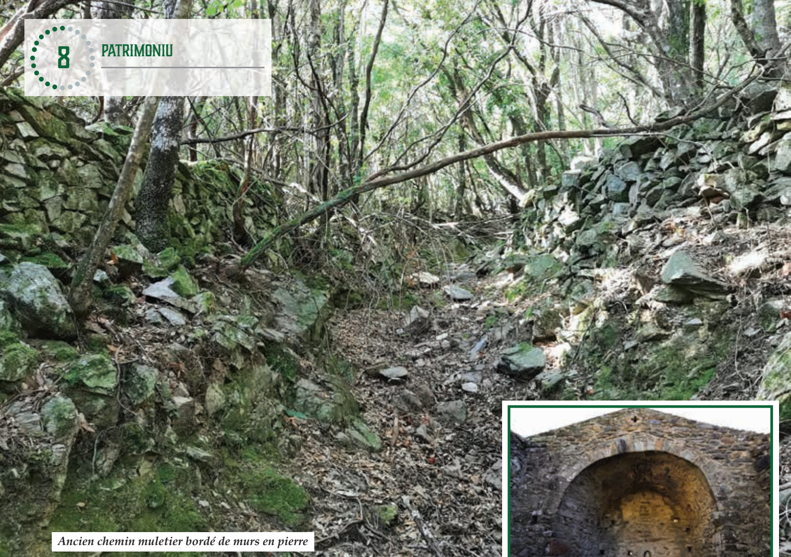
Ancien chemin muletier bordé de murs en pierre