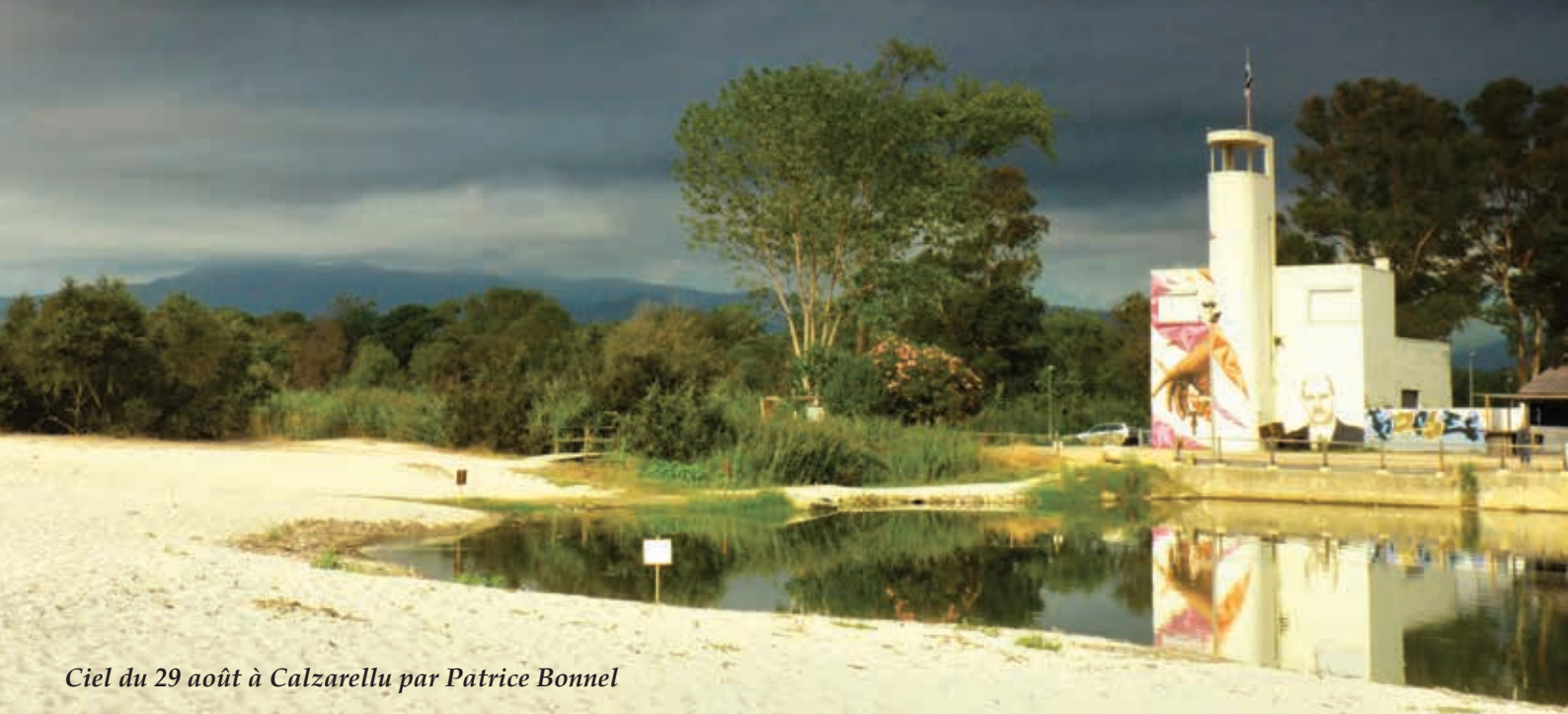
Ciel du 29 août à Calzarellu par Patrice Bonnel