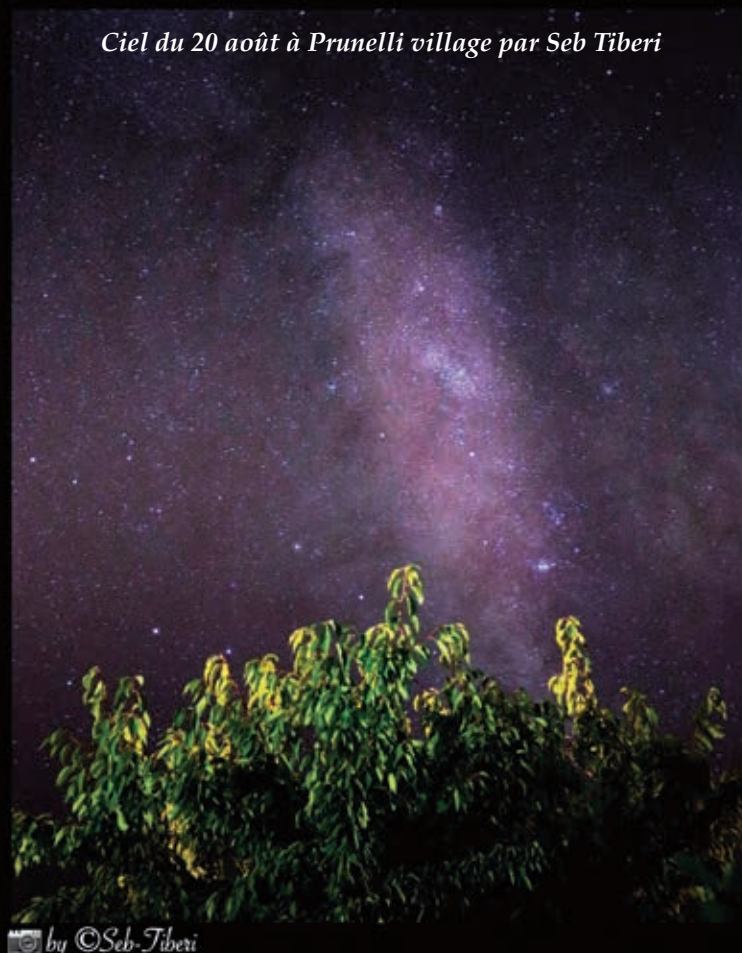
Ciel du 20 août à Prunelli village