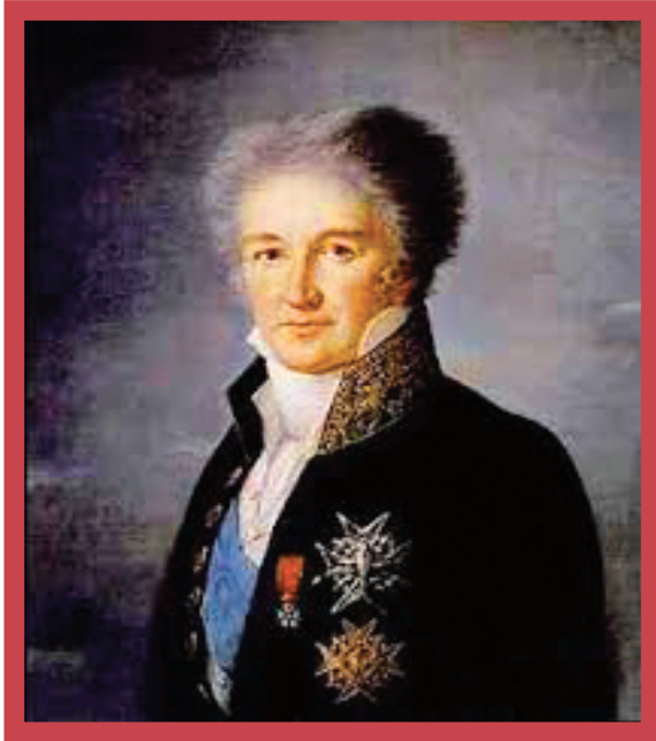
Portrait du Marquis de RIVIÈRE