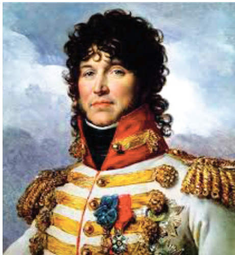
Portrait de Joachim MURAT

Considéré comme l'un des plus braves mais surtout le plus extravagant des Maréchaux de NAPOLEON, Joachim MURAT, fils d'aubergiste et beau-frère de l'Empereur est couronné Roi de Naples en 1808.