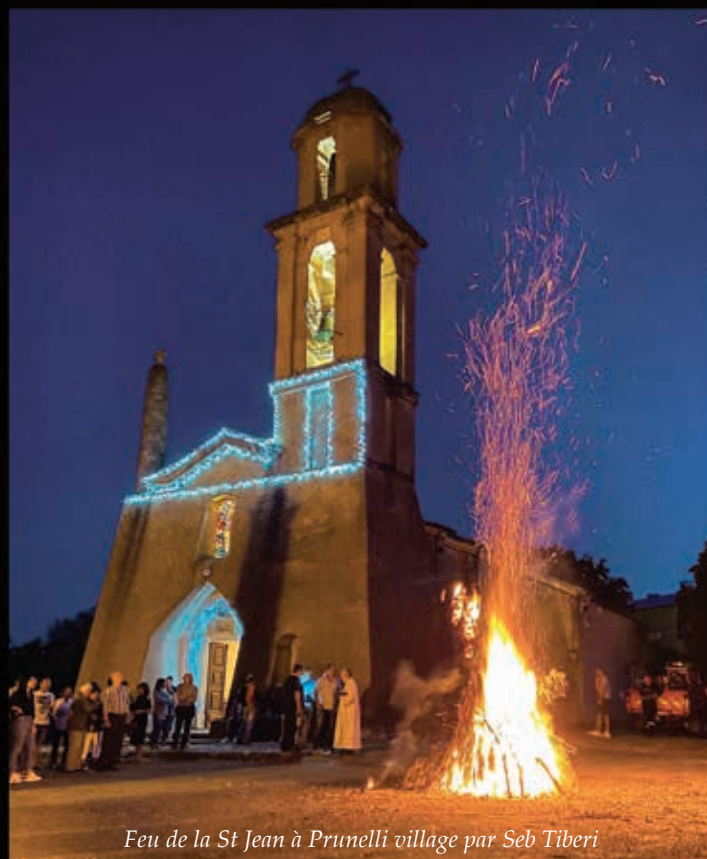
Feu de la St Jean à Prunelli village