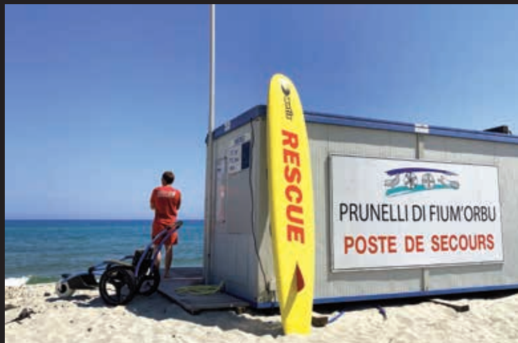
Poste de secours de Calzarellu ouvert du 29 juin au 30 août 2020