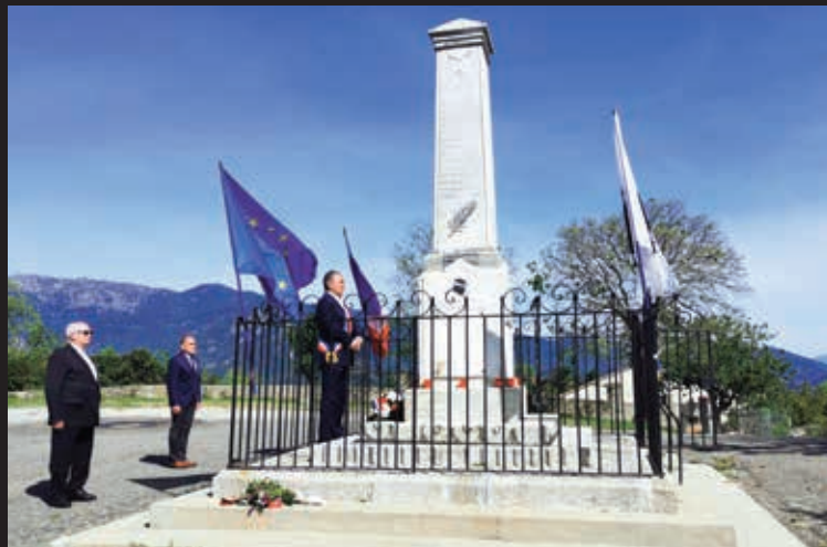
Cérémonie du 8 mai à huis clos pendant le confinement