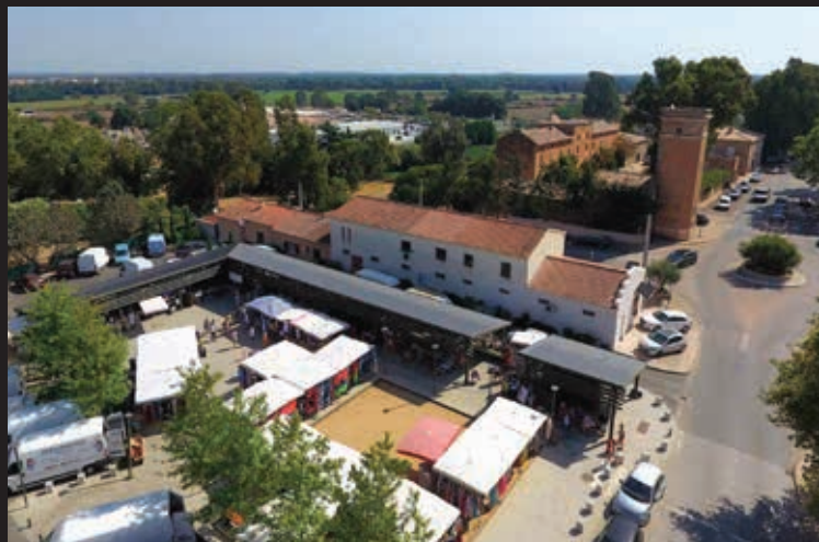
Marché de Migliacciaru tous les mardis et samedis matin