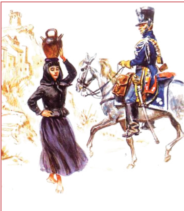
Maréchaussée et gendarmerie en Corse 1769-1830