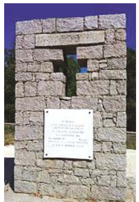
Monument à Isulacciu