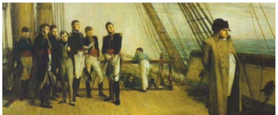
Napoleon on board the Bellerophon, Sir William Quiller Orchardson, 1880