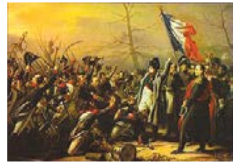
Napoleon's return from the island of Elba, Charles Auguste Guillaume Steuben, 1818

Cependant, 1812 marque l'entrée en déclin du régime. La campagne de Russie et l'invasion des coalisés l'ayant déjà bien ébranlé, Napoléon se voit trahi par ses maréchaux (dont Talleyrand). Il abdique le 4 avril 1814 et est poussé à l'exil sur l'Île d'Elbe.