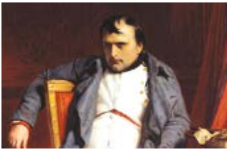
Napoléon Ier abdicant à Fontainebleau, Paul Delaroche, 1840

- Les « Cent jours » sont marqués par la Bataille de Waterloo, échec mémorable qui engendre la seconde abdication de Napoléon Ier le 22 juin 1815 et son exil sur l'Île de Sainte-Hélène où il finira ses jours jusqu'en mai 1821.