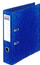
classeur à levier dos 9 cm (format A4)