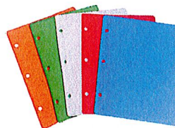
Un jeu de 12 intercalaires