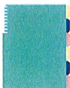
un cahier de texte