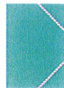
une pochette à rabats grand format