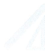
Un double décimètre et une équerre