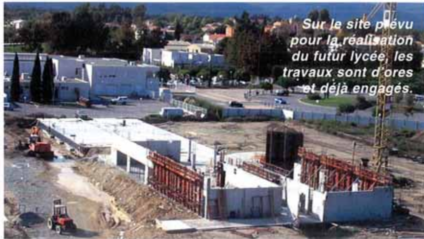
Sur le site prévu pour la réalisation du futur lycée, les travaux sont d'ores et déjà engagés.

La formule d'un lycée polyvalent avec un second cycle général et technologique et des sections d'enseignement professionnel a été retenue. L'effectif attendu, compte tenu des évolutions