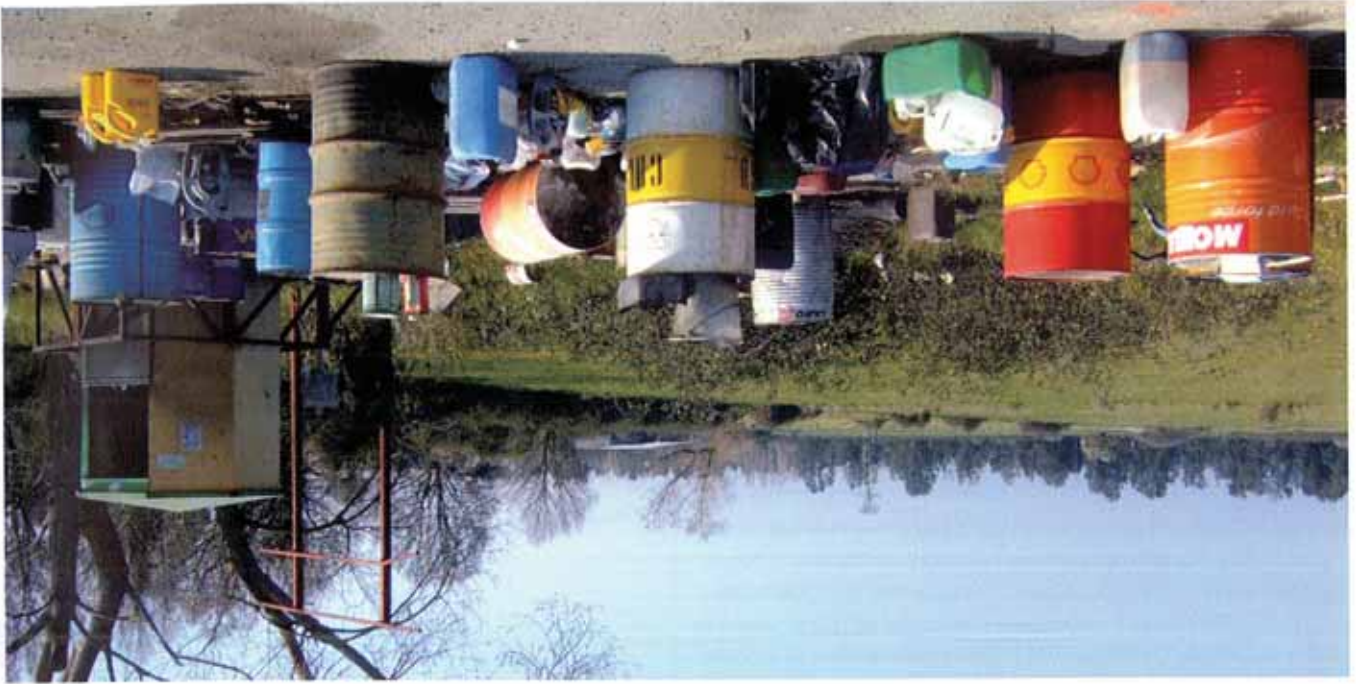
Ces bidons en question Après avoir éliminé 60 tonnes d'huile, ce récupérateur continuera son œuvre sur un site plus approprié et gardiené.