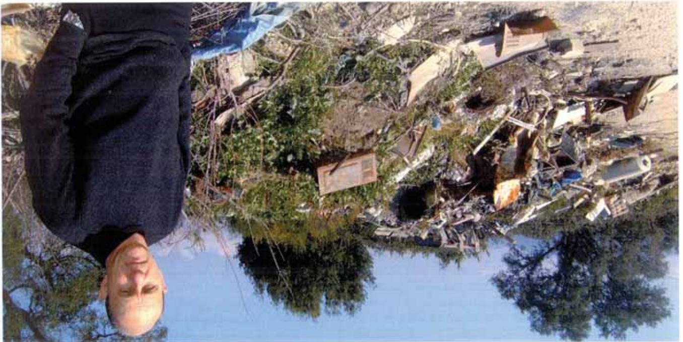
Décharge sauvage : Tristes habitudes qu'il faudra impérativement abandonner. La résorption totale de ces « points noirs » est en effet incontournable.